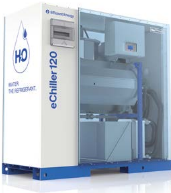
eChiller 120 incl. alle opties